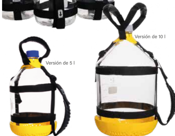
Versión de 5 l